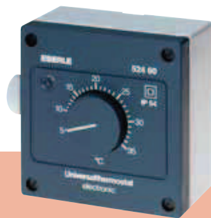
AZT-A 524 510 / AZT-A 524 410

Regulator temperatury do montáží w wilgotnych pomieszczeniach