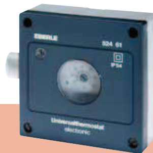
AZT-I 524 510 / AZT-I 524 410